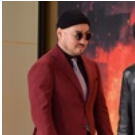
길, 또 음주운전...뒤늦은 후회